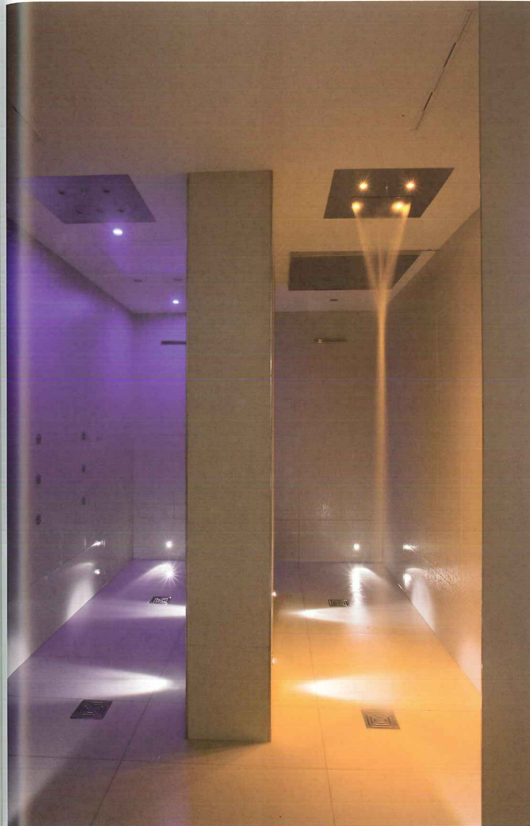
Above, the dressing rooms have an elegant and refined style. There are two different colour choices – purple for the women and magenta for the men – and they have a series of lockers that look like wood cabinets. On the right, water Paradise is designed for wellbeing – a place to regenerate under cascades and jets of water.