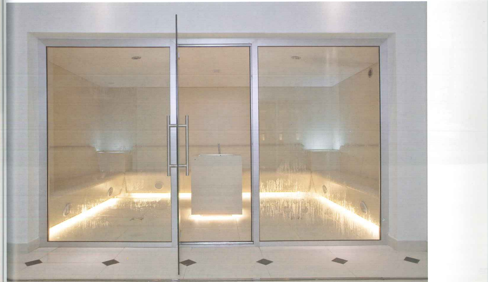
In questa pagina, alcune immagini della hall d'ingresso da cui si diramano le varie aree benessere. Nella pagina successiva: all'interno della spa ci sono anche un bagno turco e una sauna, due ambienti molto diversi tra loro delimitati su un lato da un'ampia vetrata trasparente. Il bagno turco è rivestito interamente con piastrelle bianche di dimensioni differenti.