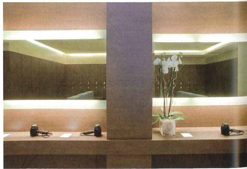
Sopra, gli spogliatoi sono ambienti caratterizzati da uno stile elegante e raffinato. Sono stati scelti due differenti colori, viola per le donne e bordeaux per gli uomini e sono stati attrezzati con una serie di gli armadietti trattati come una boiserie in legno. A destra, il Paradiso dell'acqua un percorso benessere dove potersi rigenerare sotto cascate e getti d'acqua.